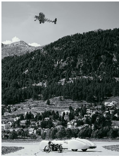
Besuchende des Kilomètre Lancé können sich auf schnelle und schöne Flugzeuge und Autos freuen.

Vom 8. bis 10. September findet zum dritten Mal das Kilomètre Lancé als Auftaktveranstaltung der internationalen St. Moritzer Automobilwoche statt. Erwartet werden Fahrzeuge der Extraklasse.